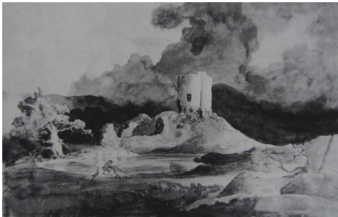
Černobílá kresba nazývaná The Traveller od britského umělce Cornelia Varleyho z počátku 19.století.

Tento zájem o ruiny lidských děl se pak spojil se zájmem o ruiny díla Božího, jak k tomu odkazoval již citovaný Thomas Burnet či filosof a myslitel z řad vysoké britské šlechty Lord ze Shaftesbury. A je jen zajímavé, že přestože oba asi nenazývají hory krásnými, je zde cítit i určité estetické zálibení – pro Shaftesburyho jsou hory esteticky hodnotnější než francouzský