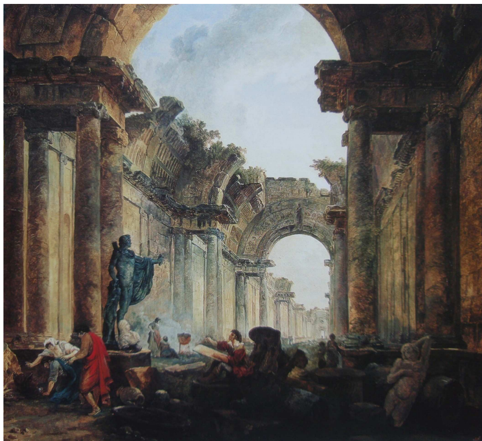
Asi nejnámějším malířem zřícenin byl Hubert Robert, ředitel galerie v Louvru, který si zde namaloval i zříceniny své vlastní instituce: Pohled na zříceniny velké galerie v Louvru , 1796.

místních obyvatel k horám a jakési depresivity či temnoty ( gloom ), vznášející se nad životem švýcarských horalů. 3