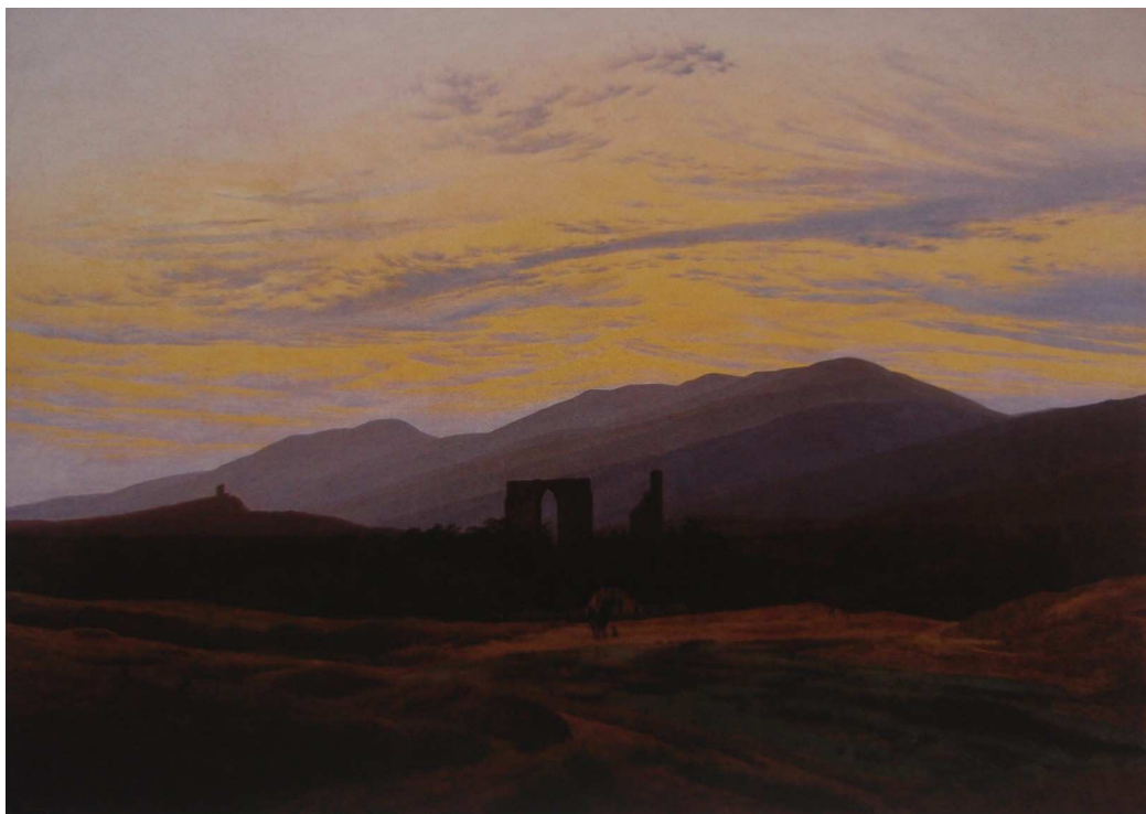
Caspar David Friedrich: Ruiny v Krkonoších , kol 1834.